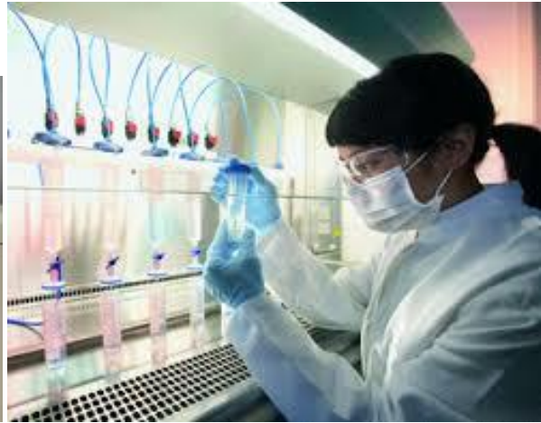
železo in voda