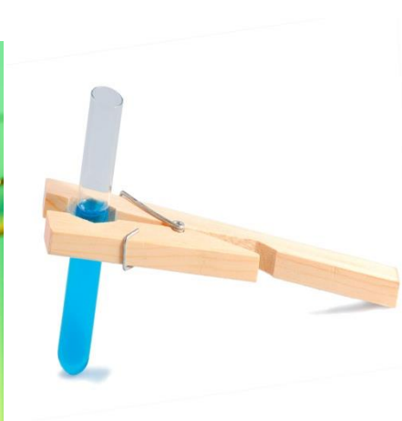
voda in modra galica