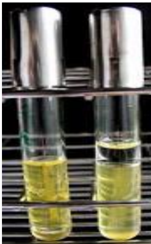
voda in kis