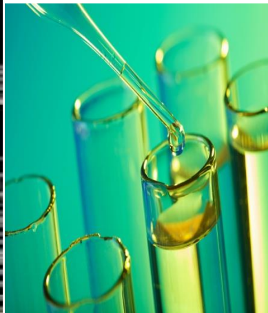
voda in alkohol