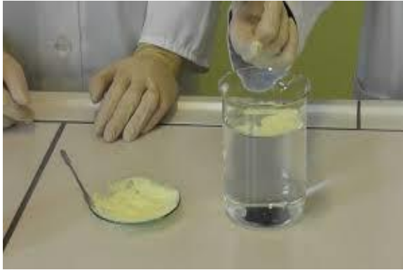
voda in žveplo